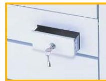
コイン回収ボックス(コイン式)