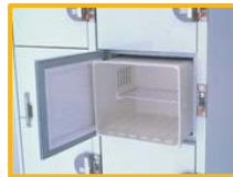
取り外しが簡単で、庫内清掃ラクラク