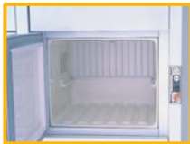
間口が広くて大きい