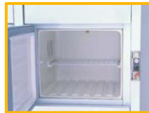
棚板をおろせば簡単に2段式として使用可能