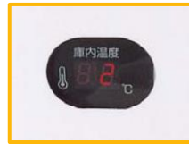
マイコン制御デジタル温度表示を採用