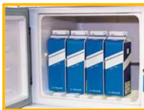
牛乳1リットルパックを立てたまま収納可能