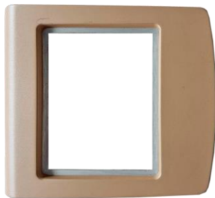
【ステンレス】 こじ開け防止 強化タイプ